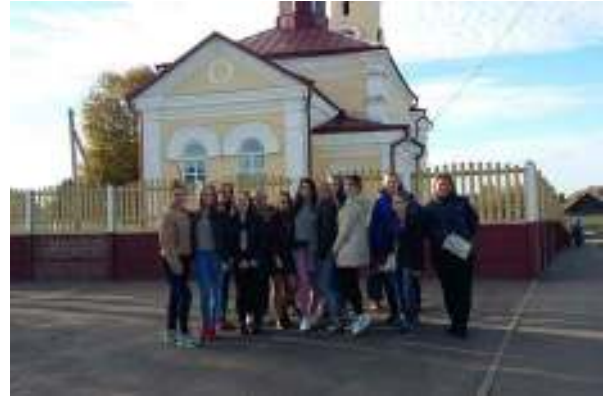
Церковь Тупичевской иконы Багоматери