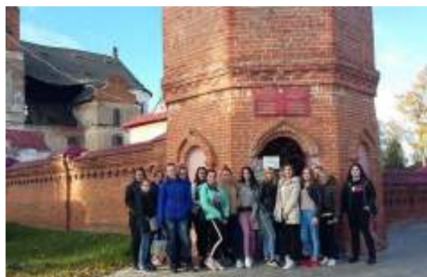
Архитектурный ансамбль Иезуитского монастыря