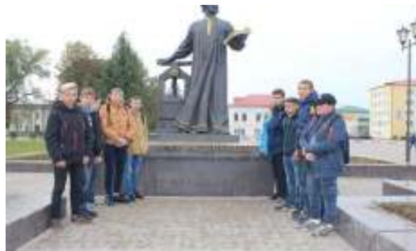
Центральная площадь. Памятник Петру Мстиславцу