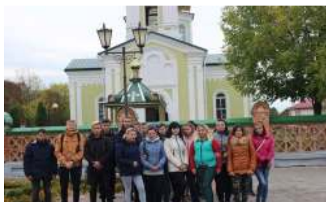
Собор Александра Невского