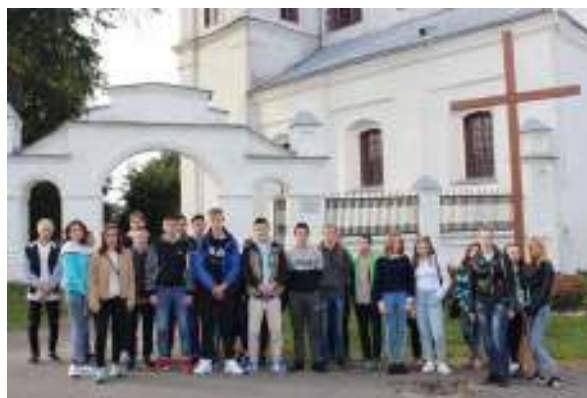
Кармелитский Успенский костел