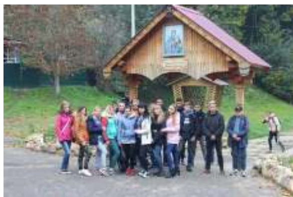
Кагальный колодец в честь Тупичевской иконы Божьей Матери