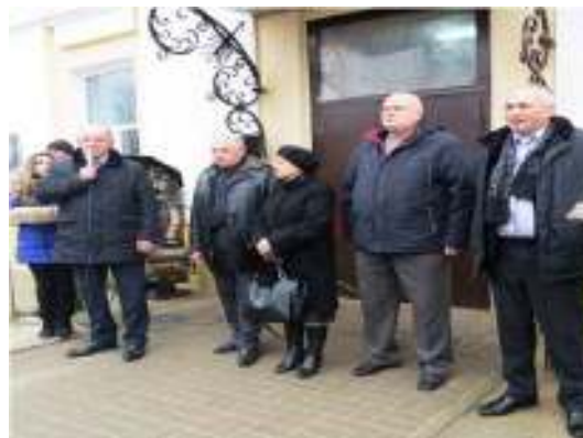
Рисунок 3.4 – Торжественное открытие музея «Спадчына» после реконструкции

Для активного вовлечения учащихся колледжа в музейную деятельность, для возможности посетить более широкой аудитории музей виртуально, начата работа над проектом «Музей будущего».