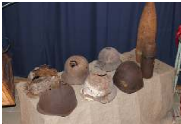
Рисунок 2.8 – Экспозиция «Огненные годы»