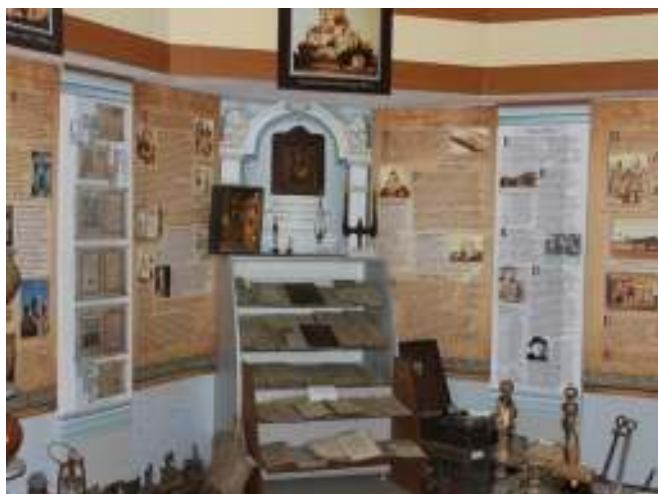
Рисунок 2.7 – Экспозиция, посвященная истории образования и культуры Мстиславщины