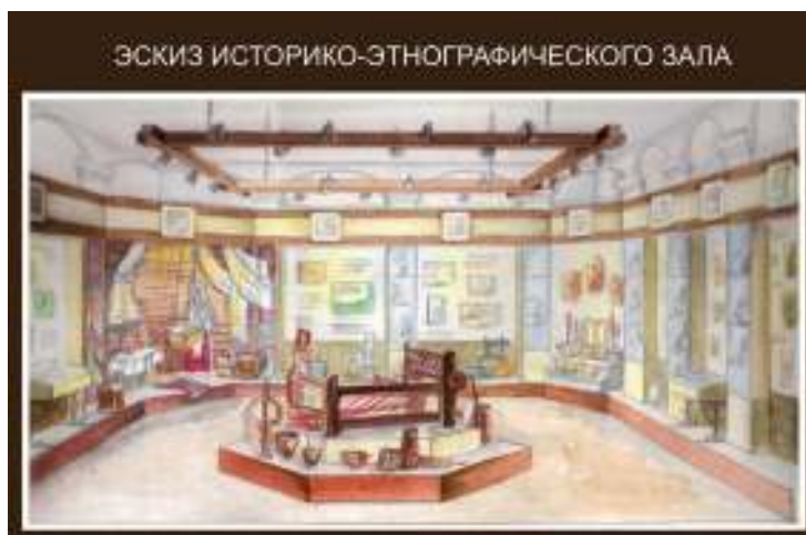
Рисунок 1.2 – Эскиз-проект историко-этнографического зала

Во втором зале разместились историко-археологические находки, вещи быта мстиславчан, реликвии военных лет, свидетельства современных событий, происходящих в городе.