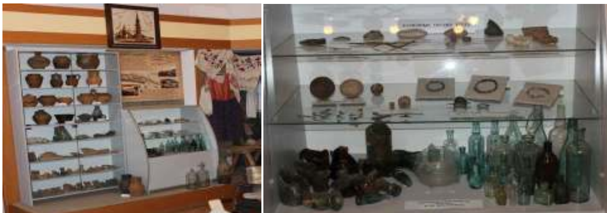
Рисунок 2.4 – Экспозиция археологических находок

В разделе археологических находок представлены каменные орудия труда, ядра, наконечники копий и стрел, украшения и предметы быта, и другие артефакты, найденные на территории Мстиславщины в результате раскопок.