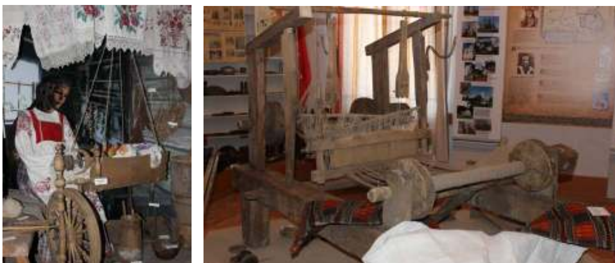
Рисунок 2.5 – Экспозиция «Белорусская хатка» и ткацкий станок

Раздел народного быта включает в себя диораму «Белорусская хатка», имитирующую интерьер крестьянской избы. Здесь представлены орудия труда, предметы быта и одежды, образцы вышивки и ткачества, характерные для крестьян, представителей наиболее многочисленного сословия, населявшего местный регион. Центральный подиум занимает ткацкий станок, реконструированный работниками и учащимися колледжа, его элементы, а также образцы оригинальной домотканой продукции.