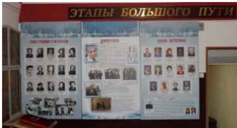
Рисунок 2.2 – Стенды, посвященные ветеранам и основателям колледжа

Тематический блок «История в лицах» содержит фотографии ветеранов и создателей колледжа, их достижения и заслуги. Здесь представлены фотографии, биографии, вклад в историю колледжа его руководителей различных периодов времени.