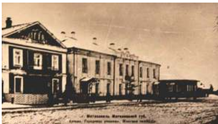
Рисунок 1. 1 – Фотография здания городского училища 1892 года

В 2015 году в связи с проведением реконструкции Троицкой церкви, было принято решение о создании музейной комнаты в исторической части учебного корпуса «МГСК».