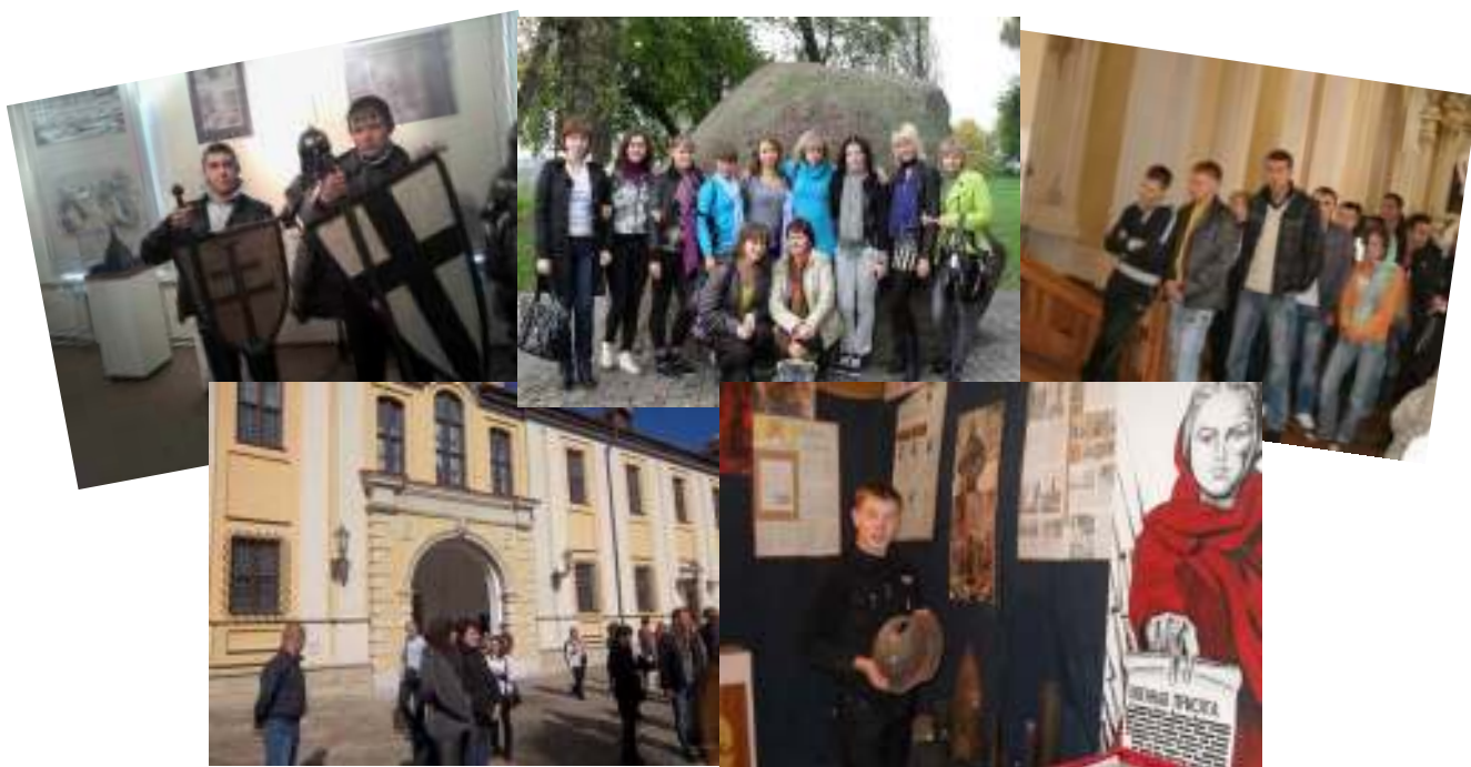
Рисунок 3.2 – Экскурсионная деятельность

С момента открытия музея «Спадчына» учащимися было проведено более 20 экскурсий. Музей посетило более 1500 человек.