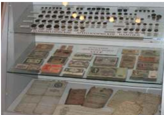
Рисунок 2.6 – Нумизматическая коллекция