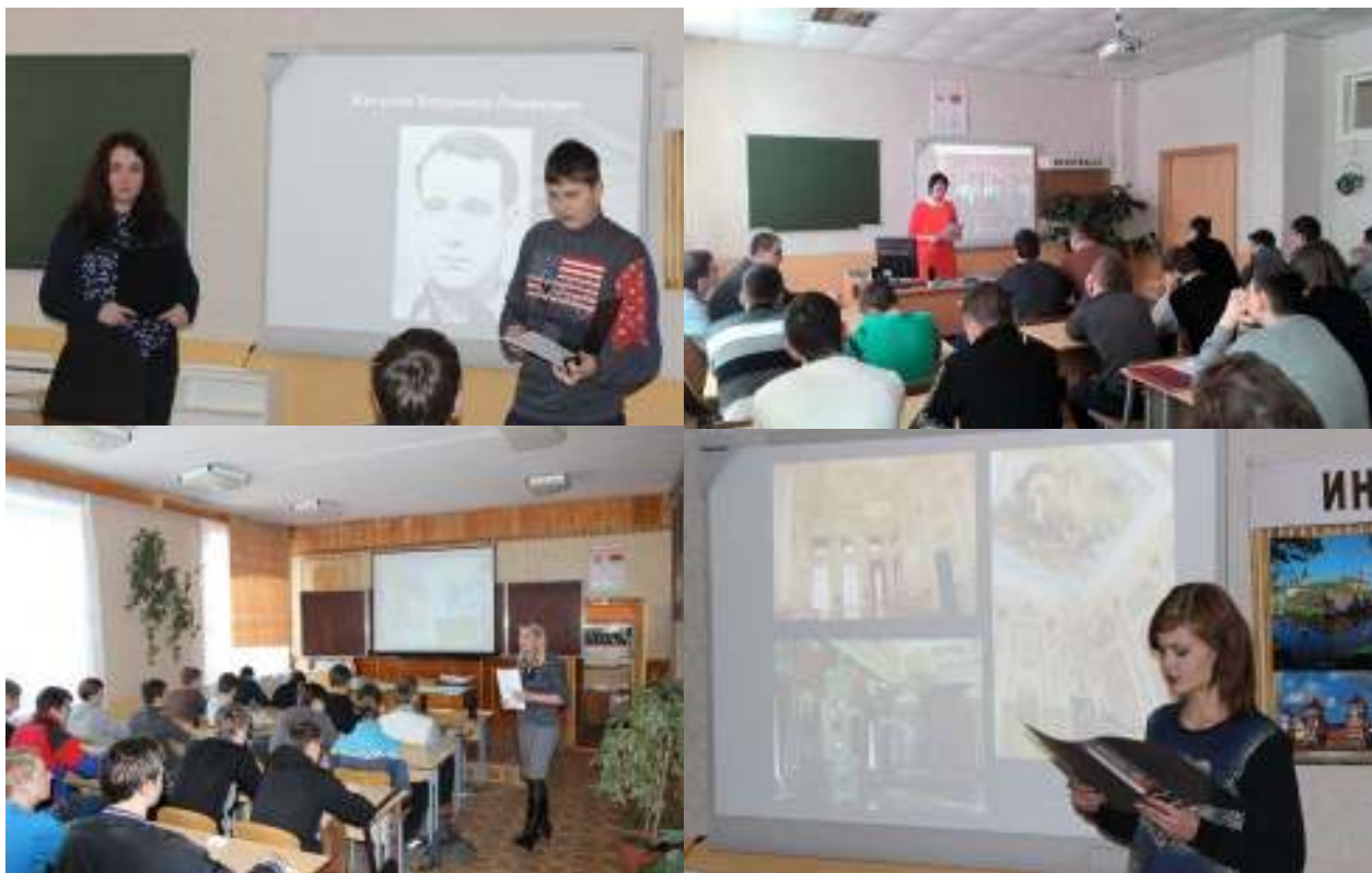
Рисунок 3.3 – Информационно-просветительская деятельность

На воспитательных мероприятиях, информационных часах, во внеурочной деятельности демонстрируются фильмы и видеоматериалы об историческом прошлом Мстиславля, проводятся встречи поколений, пресс-конференции с художниками и поэтами, священнослужителями, познавательные предметные конкурсы, викторины, игры.