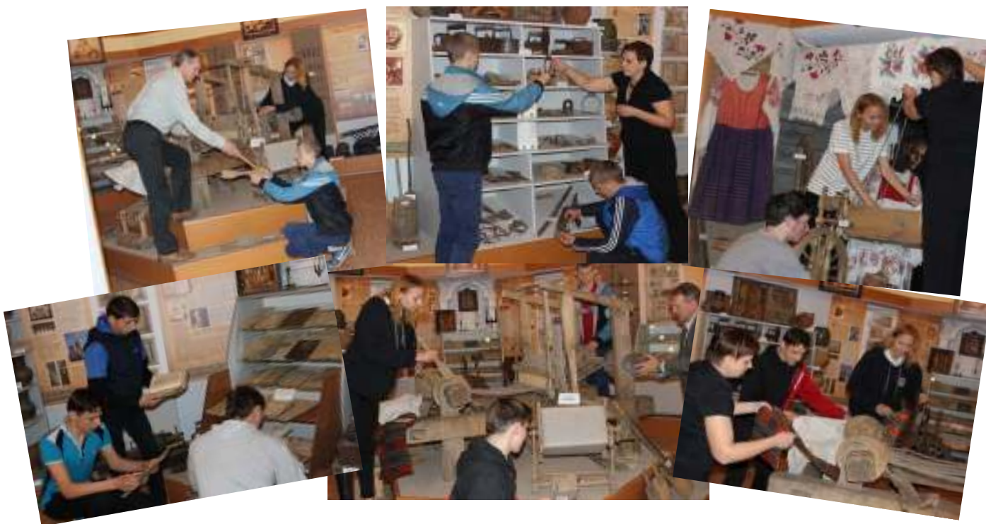
Рисунок 1.4 – Музейное сотрудничество в действии

Новая экспозиция полностью создана руками работников колледжа. В этой кропотливой работе прослеживается эффективность совместной созидательной деятельности педагогов и учащихся. Возможность получить видимый результат, стать участником творческого проекта, соприкоснуться с историей и стать ее частью, оказалась мощным стимулом проявления творческой и познавательной активности учащихся.