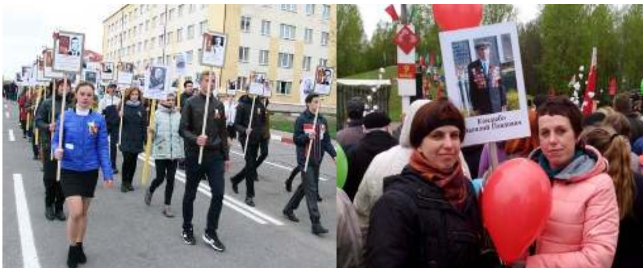
Рисунок 3.6 – Участие в акции бессмертный полк

Проект «Бессмертный полк» создан для сохранения и увековечивания ратных подвигов поколения военного времени. Участники проекта собирают и записывают воспоминания очевидцев военных лет и членов своих семей.