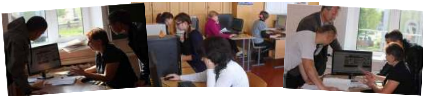
Рисунок 3.5 – Проектная деятельность педагогов и учащихся

Для активного вовлечения учащихся колледжа в музейную деятельность, для возможности посетить более широкой аудитории музей виртуально, начата работа над проектом «Музей будущего».