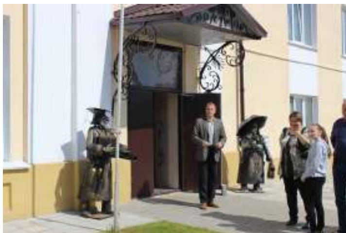
Рисунок 1.3 – Малые скульптурные формы у входа в музей