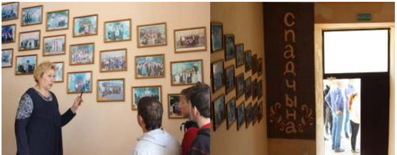
Рисунок 2.1 – Галерея выпускников

Знакомство с экспозицией музея начинается с «Галереи выпускников», которая расположена вдоль лестницы, ведущей в музей. Здесь представлены фотографии выпускных групп колледжа, начиная с 2004 года. Выпускникам посвящена и коллекция выпускных лент с 2007 года, находящаяся в зале истории колледжа.