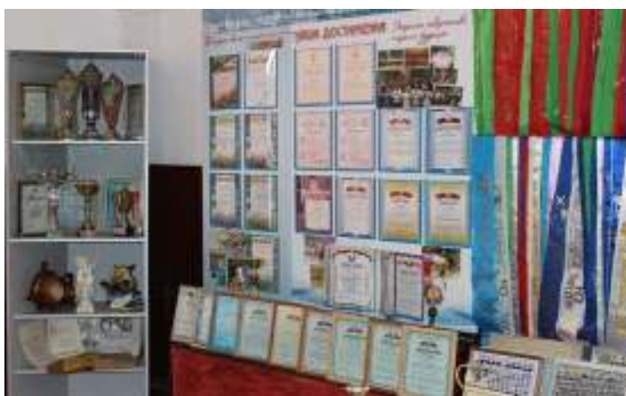
Рисунок 2.3 – Экспозиция достижений учащихся и работников колледжа

Значительная часть экспозиции зала посвящена достижениям учащихся и работников колледжа. Она включает в себя информационные стенды под рубрикой «Наши достижения» и стеллажи, на которых представлены фотографии, дипломы, кубки и медали победителей в профессиональной, спортивной, творческой деятельности.