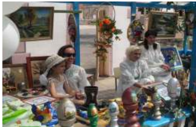
Рисунок 3.3 – Экспозиционно-выставочная деятельность

Проектная деятельность. На базе музейной площадки активно развивается проектная деятельность, основанная на тесном сотрудничестве педагогов, учащихся, ветеранов труда, общественности.