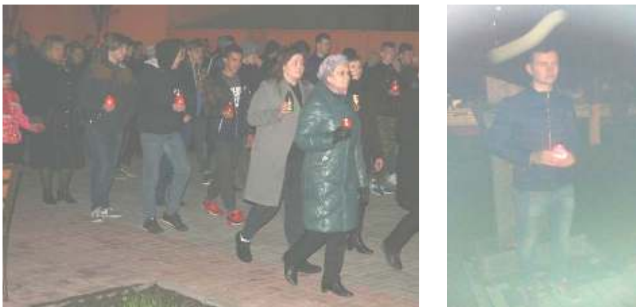
Рисунок 3.7 – 9 мая акция «Свеча памяти»